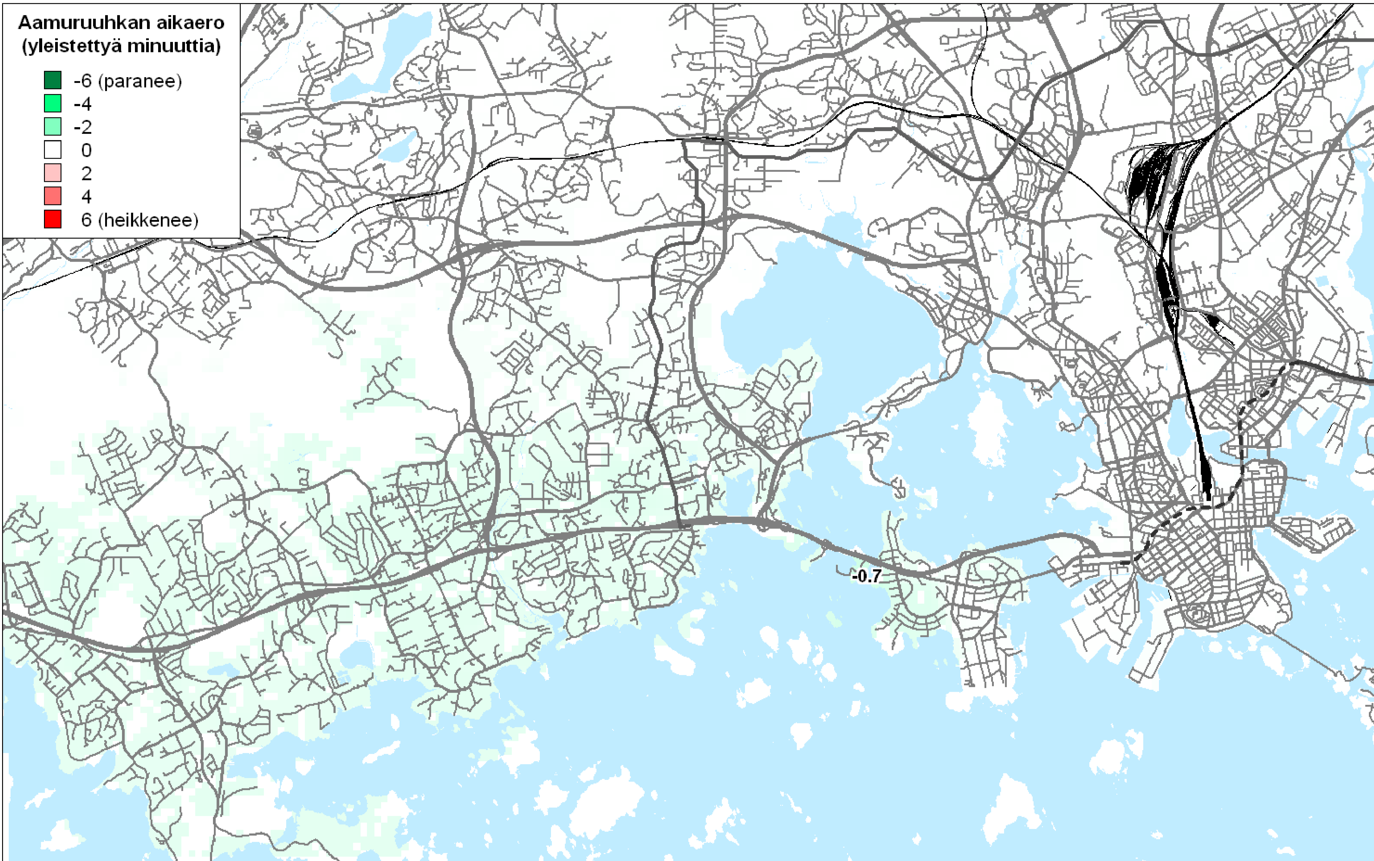
KEHITTYNYT BUSSIJÄRJESTELMÄ VERRATTU NYKYISEEN BUSSIJÄRJESTELMÄÄN

Pikaraitiotie Kamppi – Matinkylä parantaa hieman palvelutasoa Lauttasaassa (ja hieman Otaniemessä). Vaihtoehto heikentää palvelutasoa huomattavasti yleisesti Etelä-Espoossa. Länsiväylän vartta kulkeva linjaus on parempi Espoon matkustajille, mutta Lauttasaarenkadun linjaus on parempi lauttasaarelaisille